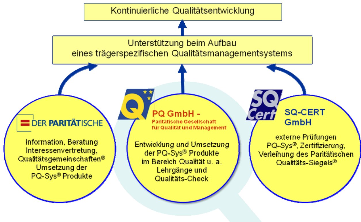
Abb. 2 Die wichtigsten Akteure im Paritätischen Qualitätssystem PQ-Sys®

Das Paritätische Qualitätssystem PQ-Sys® orientiert sich an der weltweit anerkannten Norm für Qualitätsmanagementsysteme (QMS) DIN EN ISO 9001 bzw. in der weiteren Ausprägung an dem in Europa anerkannten EFQM-Modell für Excellence . Dabei werden die anerkannten fachlichen und verbandlichen Qualitätsstandards im Sozial- und Pflegebereich und die gesetzlichen Anforderungen bezüglich QM berücksichtigt. In der Abb. 2 sind die wichtigsten Akteure des Systems dargestellt.